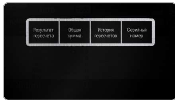
Итоги работы сортировщика, умное эргономичное управление