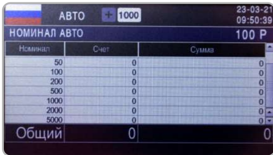
Режим АВТО, пересчет по первой банкноте